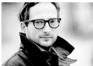
Roland Schimmelpfennig (Göttingen, Alemanya, 1967)

Va treballar com a periodista i autor independent a Istanbul abans de començar els seus estudis de direcció teatral a Munich. Després fou assistent de direcció al Münchner Kammerspiele i es va unir al seu equip de direcció artística al 1995. Ha treballat com a dramaturg per a la Berliner Schaubühne durant la temporada 1999/2000 i recentment, com a traductor als Estats Units. Actualment és autor resident al Deutsches Schauspielhaus d'Hamburg. Les seves obres s'han estrenat arreu d'Alemanya i Gran Bretanya: