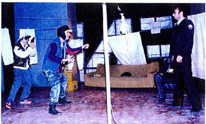
La conquesta del Pol Sud representada al terrat de casa.