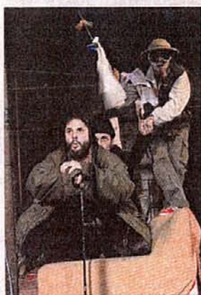
► Una escena del montaje.

La trama narra la peripécia de un grupo de marginados que, en vista de la poca halagüeña situación que viven, deciden practicar el escapismo mental representando la mítica conquista de la Antártida a cargo del grupo capitaneado por Roald