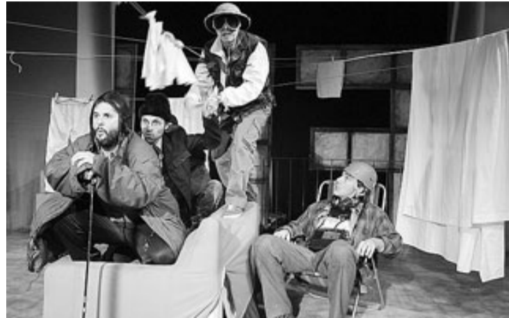
Una imatge de La conquesta del Pol Sud .

Però del que es tracta avui és d'una meravellosa expedició i d'una afortunada conquesta blanca. Lloc i hora de sortida: Sala La Planeta, nit de divendres.