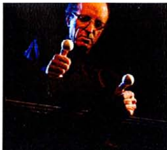
Dues boles poden ser minititelles.

Si hi ha una persona que mereix tots els respectes dins del món dels titelles és Jordi Bertran. Clàssic dins dels clàssics, amb L'alè dels fils , espectacle creat el 2008, l'artista ha volgut passejar-se pels diferents camins que li ofereix el cabaret, utilitzant la simplicitat escènica com a única eina de diàleg. El muntatge presenta una sèrie de personatges que intenten desvetllar-nos, amb petits tastets, els racons que amaga l'ànima humana. Malgrat que l'intent tingui un segell indiscutible, no podem dir que sigui un dels millors espectacles de Bertran. La manca d'una poètica escènica que ens entredreixi, però sobretot l'inexistent lligam dramàtic entre totes les escenes, fan del muntatge un simple espectacle de varietats que no va més enllà del pur entreteniment. Tot i així, el mestratge de Bertran és en escena. Amb una manipulació aparentment