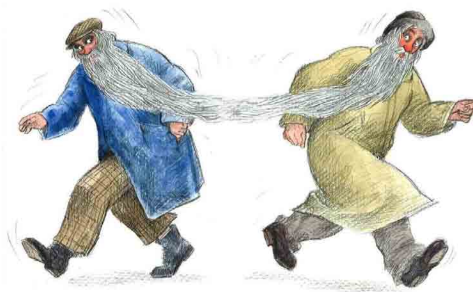
Il·lustració de Mariel Soria

I aquí és on comencen els problemes. Les peripècies de Zw i Du són grotesques i estan abocades al fracàs. És una situació tràgica però més aviat còmica i amb el seu cantó màgic.