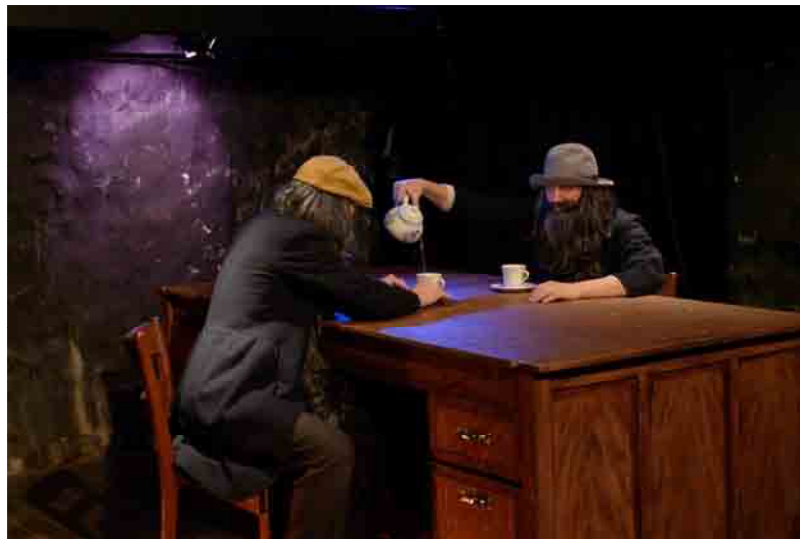
Zwdu o El dubte/Le doute/Der Zweifel

De l'estudi introductori a En cartell 24 (Barcelona: editorial Rema12, 2009)