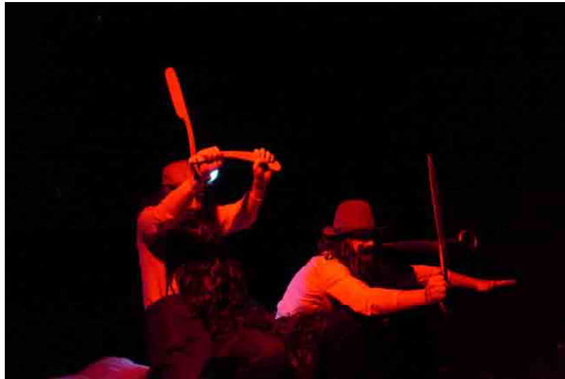
Zwdu o El dubte/Le doute/ Der Zweifel